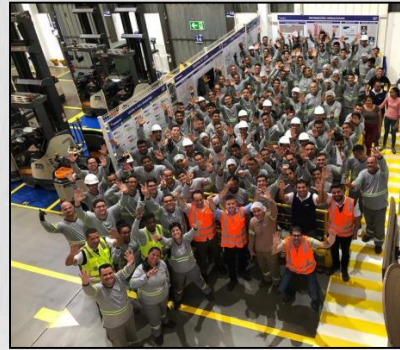
Grupo Trino na fábrica da Mabel, Aparecida de Goiânia – Goiás.