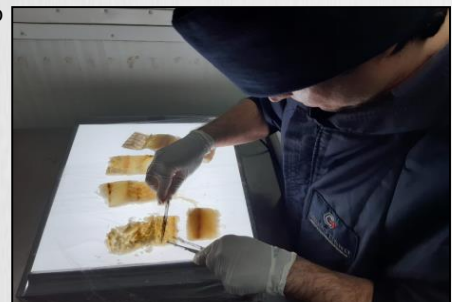
Pesquisa visual de parasitas em pescados.

Uma das análises feita no Laboratório de Qualidade da Trino Frio é a pesquisa visual de parasitas em pescados. Essa análise atende ao disposto no Memorando - Circular nº 02 / 2018 / CGI / DIPOA / MAPA / SDA / MAPA.