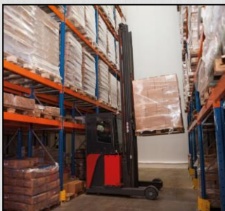
Operação logística realizada na Trino Frio, Pernambuco.